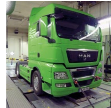
Nutzfahrzeug End-of-Line Rollen-Prüfstand

Die Prüfmöglichkeiten reichen hierbei von Bremsen- und/oder Leistungstests bis hin zur Prüfung von Elektronikbausteinen (ABS, ASR ...).